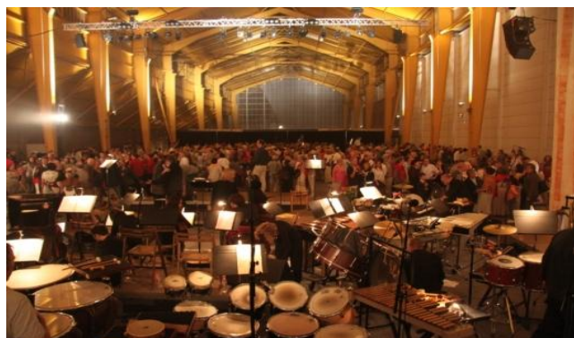
Août 2010 Concert de fin de Stage

Cette impressionnante saga poétique, élevant jusqu'au ciel, par le symbole de l'arbre de feu, les larmes et les victoires de l'humanité, a été mise en musique par Mikis Theodorakis, au nom des mêmes idéaux pour lesquels il a été emprisonné, déporté, torturé et exilé.