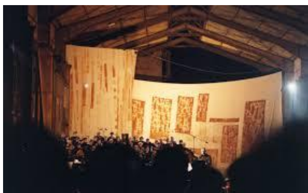
Canto General 1998 dans le Parc à Mitraille

Pour cette nouvelle édition produite par La Badinerie et soutenue par différents partenaires, le Parc à Mitrailles pourra accueillir plus de 3000 spectateurs.